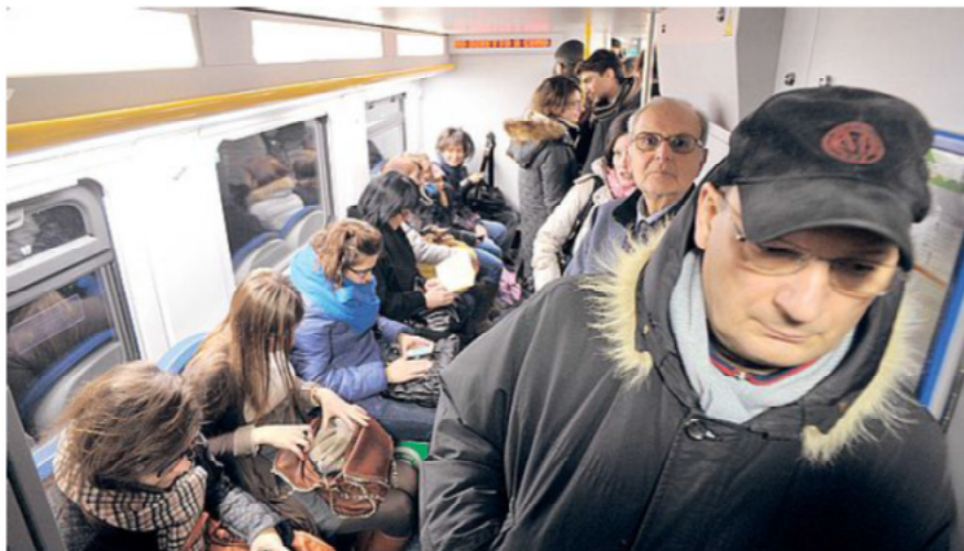
Continua il viaggio de La Nazione fra i quotidiani problemi dei viaggiatori pendolari, fra treni sporchi, convogli soppressi, ritardi e linee lente. Nei prossimi giorni arriveranno altre puntate di aggiornamento

E il sovraffollamento? «C'è un solo modo per abbatterlo: far circolare più treni nelle ore di punta - conclude il direttore - Quando il sottoattraversamento fiorentino sarà finito, l'attuale rete promiscua sarà libera e si potranno aumentare i convogli».