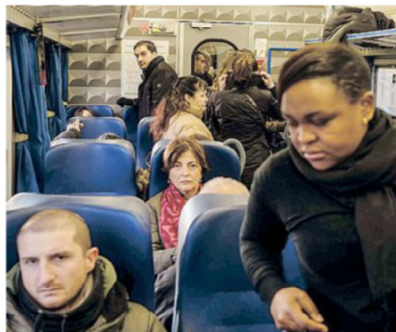
I pendolari a bordo del regionale 11666